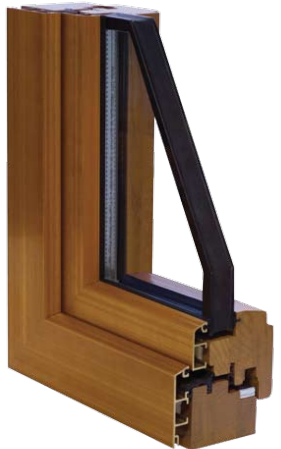
Tilt & turn windows Fenêtres oscillo-battantes Окна поворотно-откидные Okna rozwierno-uchylne